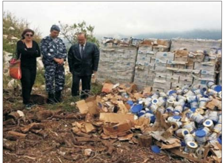
Vingt tonnes de boîtes de lait pour nourrissons, périmées et abandonnées près d'un camp au Liban pour réfugiés syriens, 2015

Fournir du lait pour nourrissons pendant les situations d'urgence crée des marchés juteux dans les pays en voie de développement et augmente les déchets tout en laissant des empreintes écologiques (carbone, matières premières, eau) beaucoup plus élevées que pour le lait maternel.